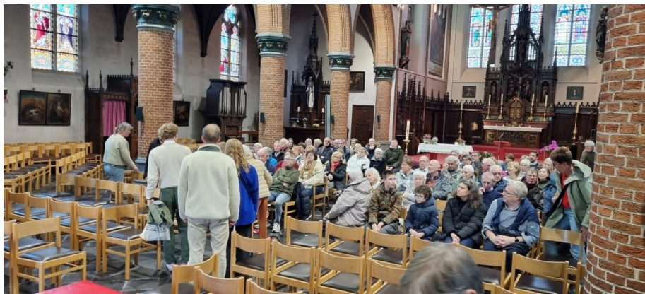
Familie en parochianen schuiven aan om het Beziingsmoment bij te wonen