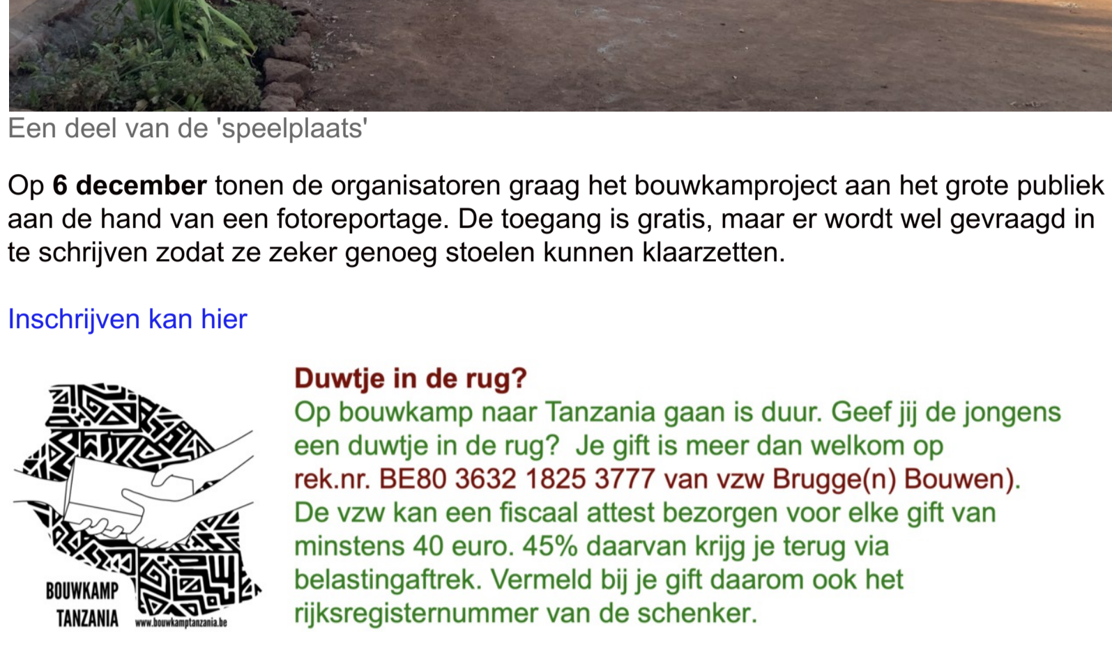
Een deel van de 'speelplaats'

Op 6 december tonen de organisatoren graag het bouwkampproject aan het grote publiek aan de hand van een fotoreportage. De toegang is gratis, maar er wordt wel gevraagd in te schrijven zodat ze zeker genoeg stoelen kunnen klaarzetten.